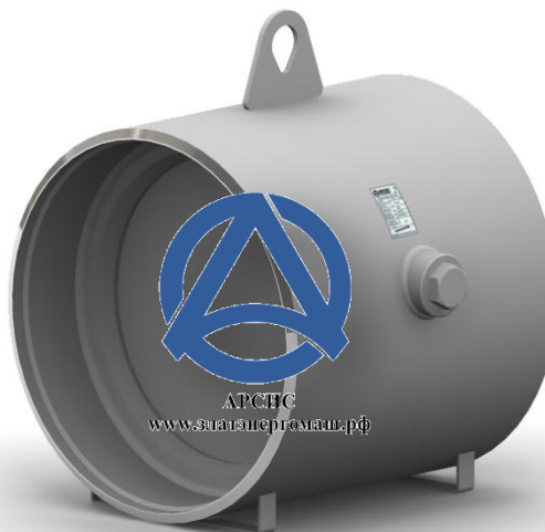
Клапан 19с49нж DN 500 PN 25

Клапан 19с49нж имеет схожую внутреннюю конструкцию с 19с47нж. Все отличие заключается в увеличенном диаметре и как следствие, в уменьшенном размере противовеса. Это связано, прежде всего, с тем, что данный клапан имеет большие габариты и, следовательно, диск (захлопка) имеет самодостаточную силу для прижатия к седлу, что обеспечивает необходимую герметичность клапана.