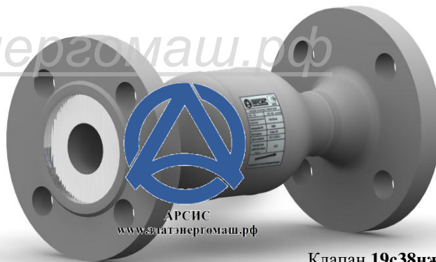
Клапан 19с38нж DN 32 PN 40